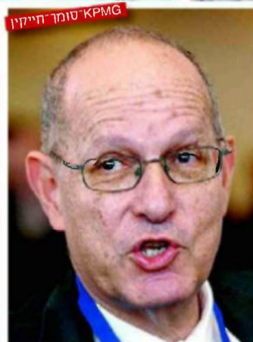
KPMG סומך חייקין