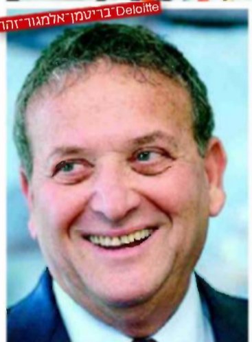
Deloitte בריטמן אלמגור זוהר