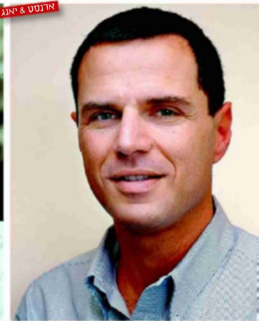
ארנסט & יאנג