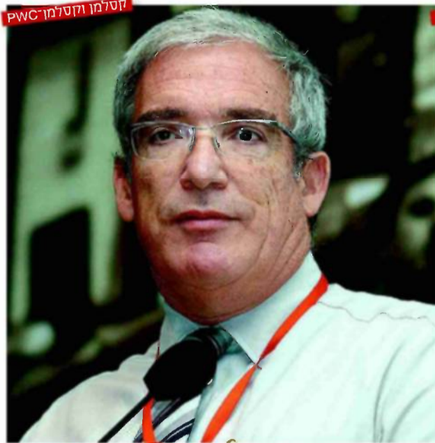
קסלמן וקסלמן PwC